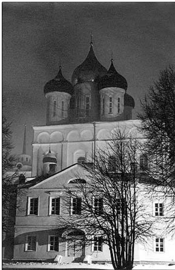
Псков. Свято-Троицкий собор и здание, в котором располагалась Псковская Духовная миссия